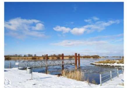
Sogar die Ems hat gefroren.