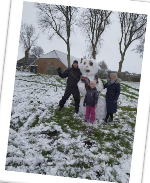
Schneemannbauen? Ein Muss!!!