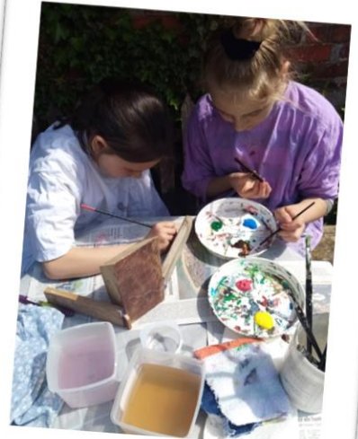
Kreativ & bunt: Das Haus der Ems-Fee entsteht