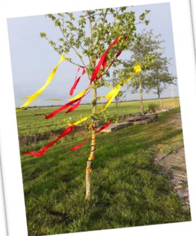
... MM (noch) schöner am 1. Mai: