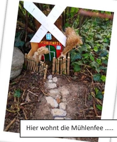
Hier wohnt die Mühlenfee .....

https://www.youtube.com/channel/UC5ATSD2dOcccEmivfkXfnxQ !